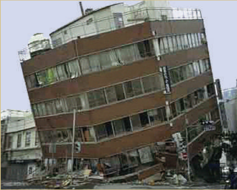
تخریب خانه ها در اثر حادثه طبیعی زلزله

در درس قبل با دو مؤسسه خدمات اجتماعی آشنا شدید. در این درس با دو مؤسسه دیگر آشنا می شوید.